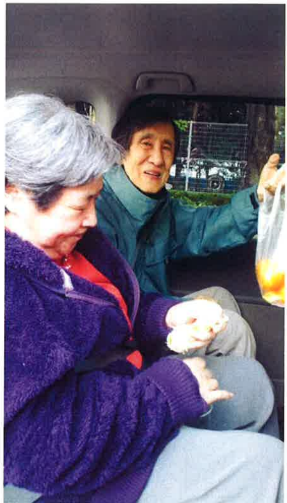
ドライブ車中でおみかんパクリ