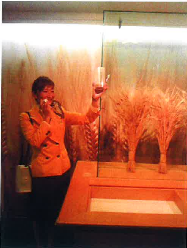
ビール工場見学 麦芽の説明を受けております