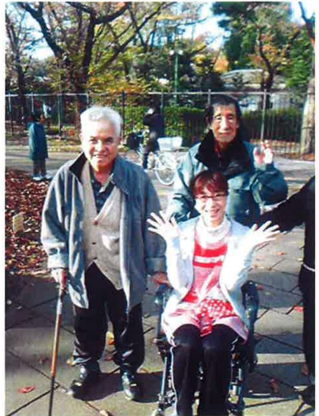
黄色いジュウタンを踏みしめて