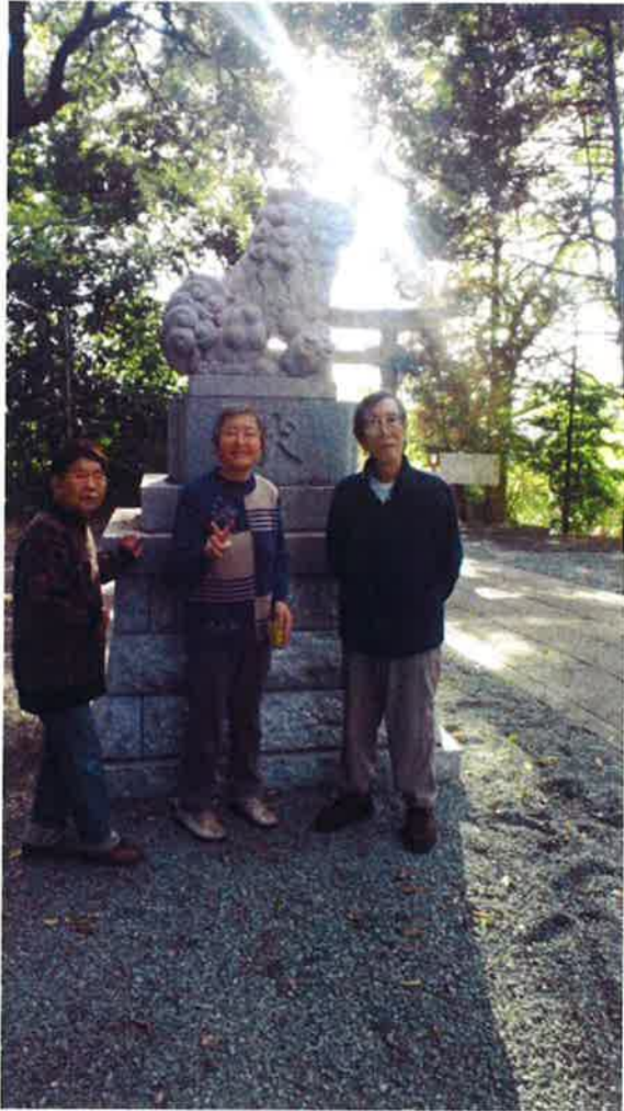
谷保天満宮で来年の健康を祈願