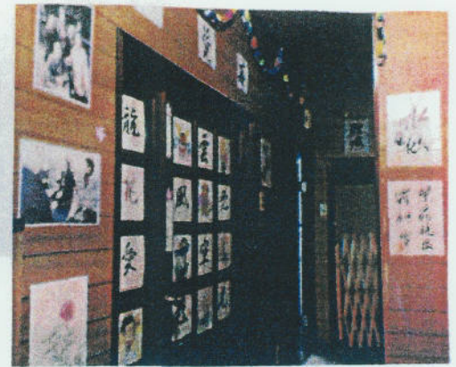
デイサービスセンター初台 (玄関入口)